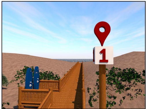
PERSPECTIVA 3D - 01 Escala: 1:1