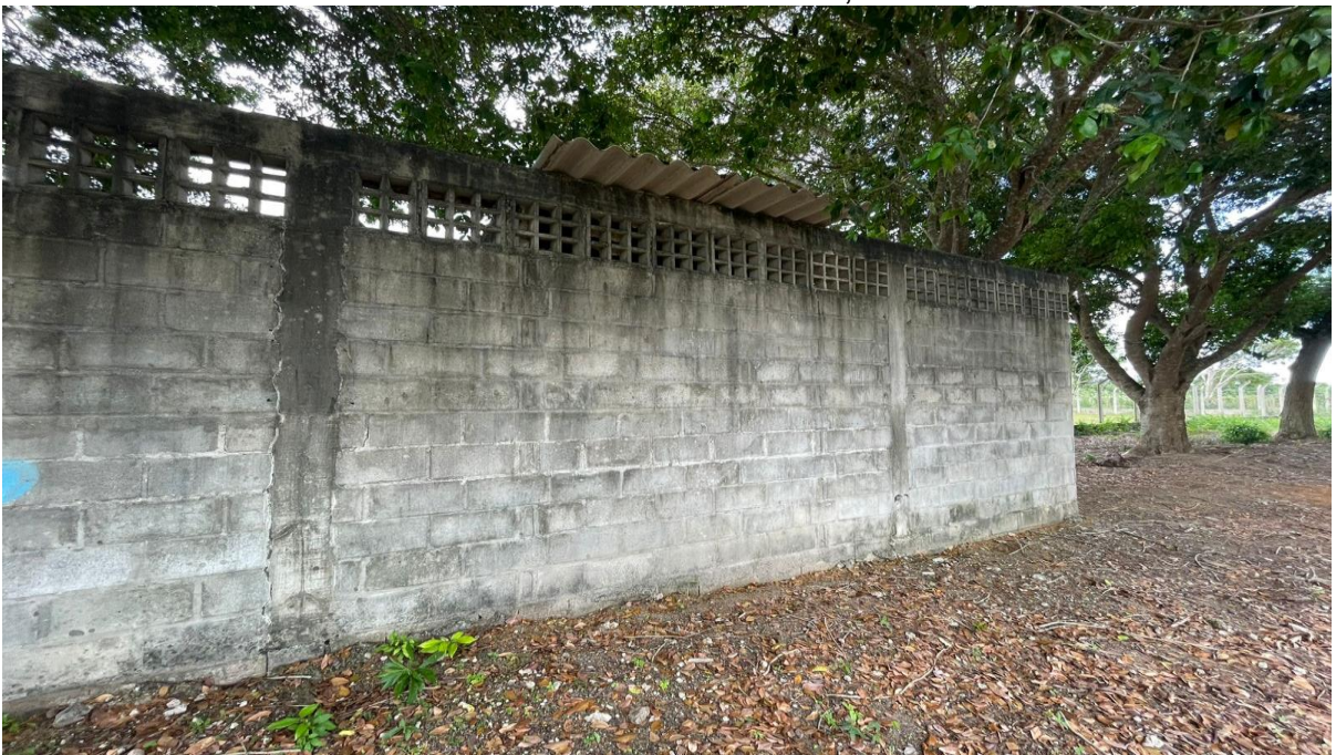
FIGURA 02 – Vestiário existente a ser reformado, na comunidade Vale da Vitória.