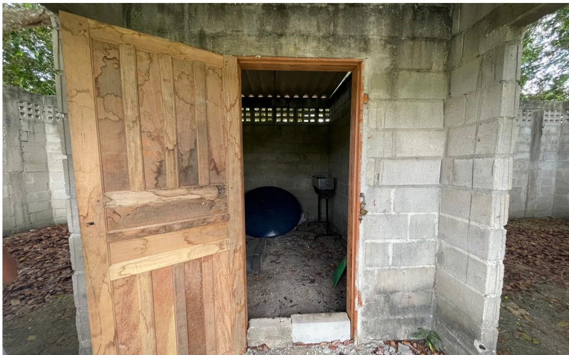
FIGURA 05 – Vestiário existente a ser reformado, na comunidade Vale da Vitória.