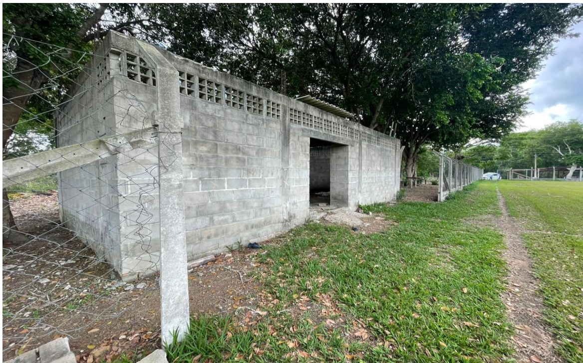
FIGURA 03 – Vestiário existente a ser reformado, na comunidade Vale da Vitória.