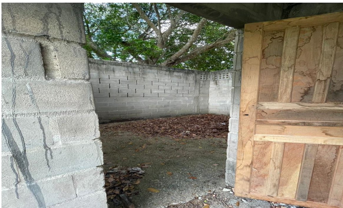
FIGURA 06 – Vestiário existente a ser reformado, na comunidade Vale da Vitória.