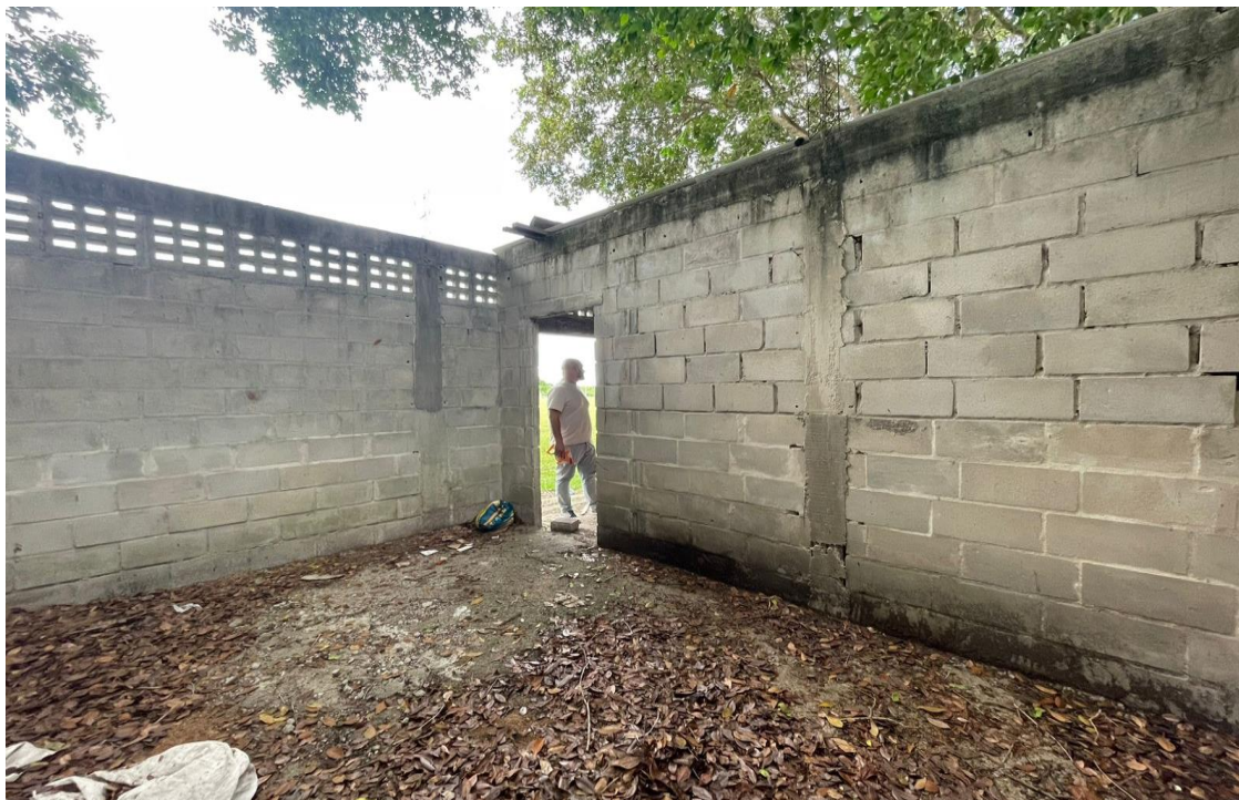
FIGURA 09 – Vestiário existente a ser reformado, na comunidade Vale da Vitória.