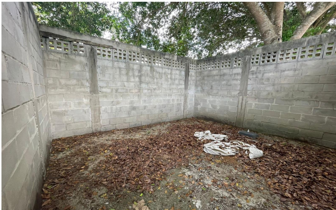
FIGURA 07 – Vestiário existente a ser reformado, na comunidade Vale da Vitória.