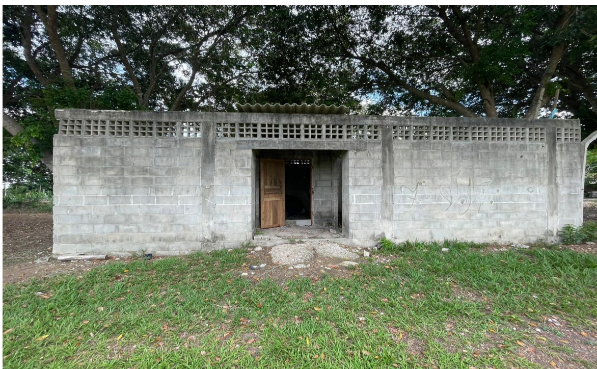
FIGURA 04 – Vestiário existente a ser reformado, na comunidade Vale da Vitória.