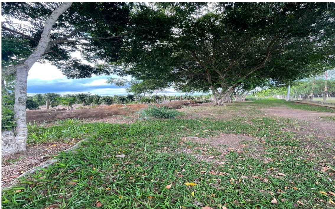
FIGURA 10 – Espaço para realizar a construção do vestiário na Comunidade Palmeira.

Os vestiários são recursos vitais para as comunidades, seja para atividades esportivas, eventos sociais e outras necessidades específicas, e a obra beneficiará diretamente os usuários.