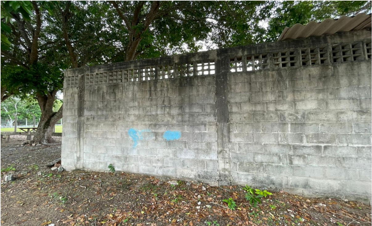
FIGURA 01 – Vestiário existente a ser reformado, na comunidade Vale da Vitória.