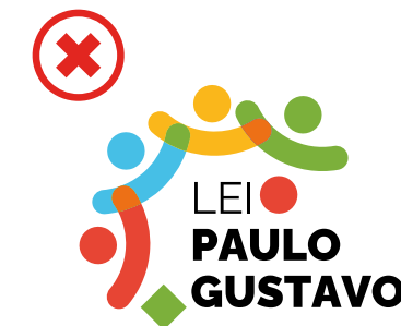
Não inserir elementos não previstos