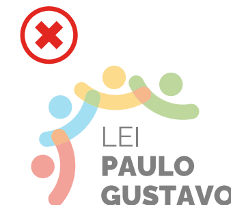
Não alterar a opacidade