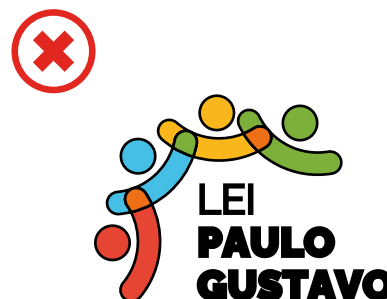
Não utilizar contornos